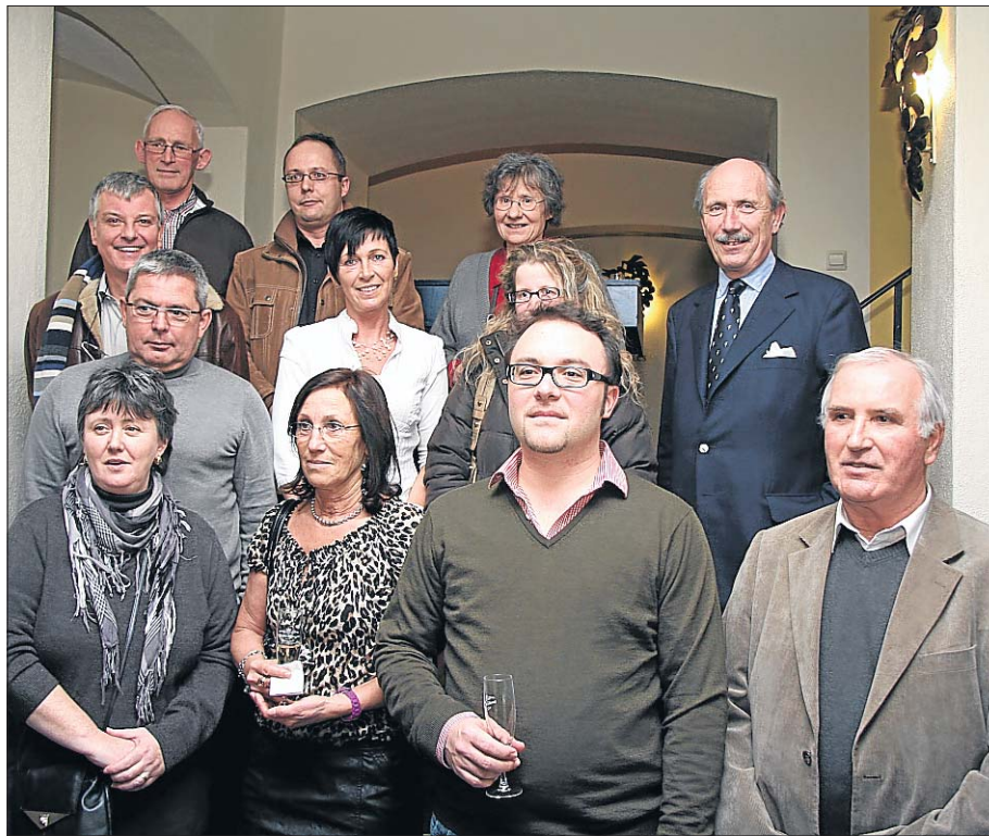
Les récipiendaires ont savouré la Cuvée anniversaire 90 ans de Bernard Massard, une édition limitée.

Remise des prix chez Bernard-Massard dans le cadre des 90 ans des caves